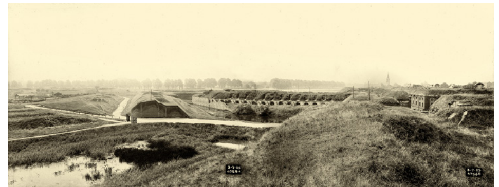
Zicht op de veldzijde van de Genieekazerne (Kazerne 8-9) in 1925, het toekomstige Brialmontpark.

Voor meer info over de wandeling zelf kun je bij ons terecht op 03 292 51 15 of via e-mail op wandeling@hkberchem.be