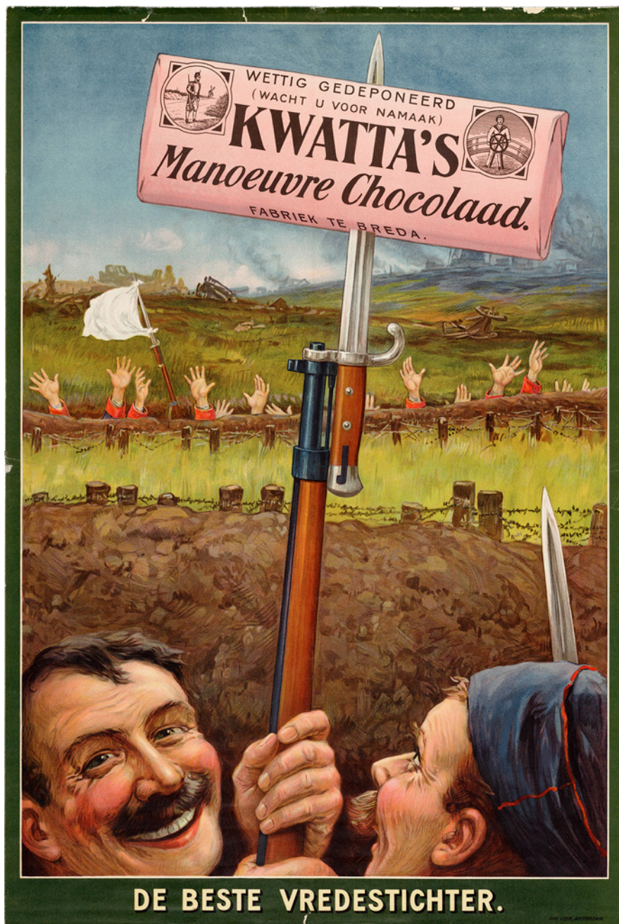
Affiche: Kwatta's Manoeuvre chocolaad. De beste vredestichter. | 1914-1918 Uitgever: Van Leer